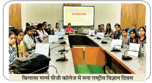
बिलासा गल्स पीजी कॉलेज में मना राष्ट्रीय विज्ञान दिवस