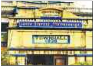
निगम स्वच्छता के लिए जोनवार लक्ष्य तय कर रहा है।

निगम स्वच्छता के लिए जोनवार लक्ष्य तय कर रहा है। सर्वे के दौरान फील्ड निरीक्षण, नागरिक फीडबैक, दस्तावेजी मूल्यांकन और ऑनलाइन ऑकलन के आधार पर अंक दिए जाएंगे। अधिकारियों ने सभी जोनों को समय-सीमा में सभी कार्य पूरे करने के निर्देश भी दिए हैं। लापरवाही बरतने वालों पर कार्रवाई भी की जाएगी।