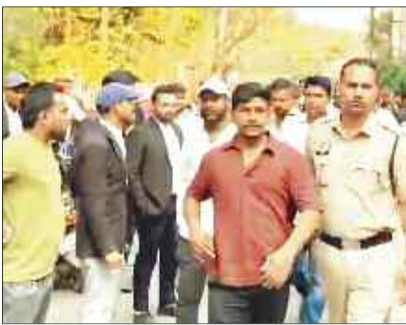
आरोपियों को जेल ले जाती पुलिस।