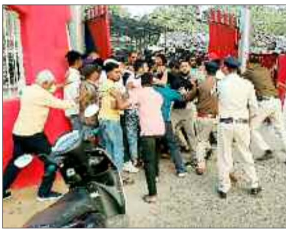
जेल दाखिल करते समय समर्थकों ने की पुलिस के साथ हुज्जतबाजी।