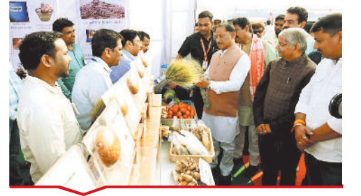
प्रदर्शनी का निरीक्षण करते मुख्यमंत्री विष्णुदेव साय सहित अन्य जनप्रतिनिधि

[बिल्हा | मस्तूरी | तखतपुर | मुंगेली | कोटा | लोरमी | सरगांव | पेंड़ा | बेलतरा | रतनपुर | पथरिया]